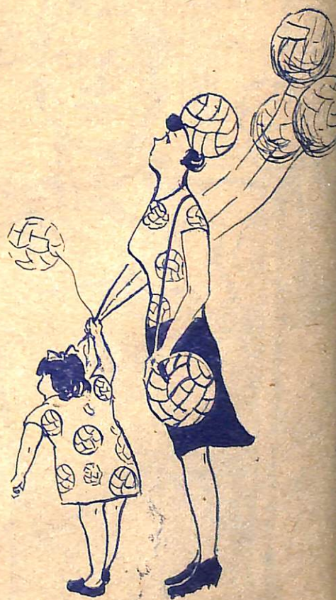
В семье больничка. Рисунки А. Тимофеева.